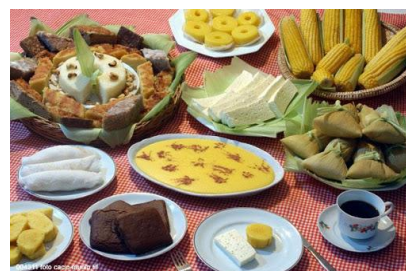
IMAGENS RETIRADAS DA INTERNET - JUNHO/2020.

OUTRO ELEMENTO IMPORTANTE DAS INTERAÇÕES SÃO OS JOGOS E BRINCADEIRAS.