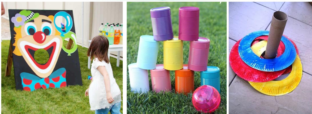
IMAGENS RETIRADAS DA INTERNET - JUNHO/2020.

SUGERIMOS QUE CONFECCIONEM COM AS CRIANÇAS, JOGOS DA TRADIÇÃO JUNINA QUE QUEIRAM COMPARTILHAR COM ELES, COMO: TOMBA LATAS, BOCA DO PALHAÇO, PESCA, ENTRE OUTROS. TORNANDO ESTE MOMENTO DE SOCIALIZAÇÃO FAMILIAR, UM ESPAÇO DE ALEGRIA E BRINCADEIRAS, E DE COMPARTILHAMENTO DE VALORES CULTURAIS.