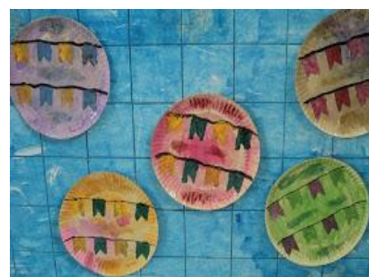
IMAGENS RETIRADAS DA INTERNET - JUNHO/2020.

AS FESTAS DA COLHEITA TAMBÉM SÃO SINÔNIMOS DE MUITA COMILANÇA, EM QUE ACONTECE A PARTILHA DE MUITOS PRATOS DOCES OU SALGADOS COMO: PIPOCA, PINHÃO, PÉ DE MOLEQUE, CANJICA, BOLOS, ENTRE OUTROS PRATOS DELICIOSOS.