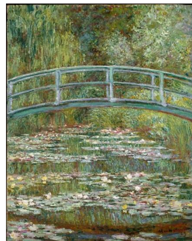
Ponte sobre uma lagoa de lírios

O preto e o branco são cores neutras porque podem ser empregadas com todas as cores para obter tons mais claros ou escuros. O branco é resultado da junção de todas as cores, e o preto é ausência delas. Quanto maior o domínio técnico do artista no emprego das cores, maior será o potencial expressivo de sua obra.