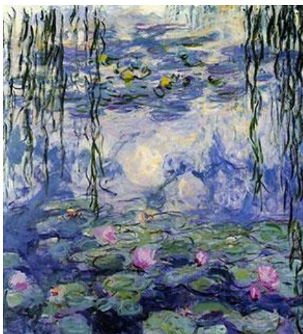
Nenúfares de água (1899)

esverdeados e violeta. O pintor francês Claude Monet (1840-1926) produziu muitas obras que despertam essas sensações, confira abaixo: